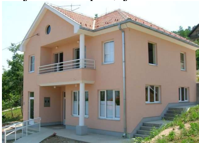
Кућа УГ „Загрљај“

Основано почетком 2002.год., окупља ОСИ различитог узраста, са разним видовима ометености у менталном, физичком и сензомоторном развоју, као и особе са комбинованим сметњама. Наши програми и пројекти се односе углавном на децу и младе. Мисија: Интеграција особа са инвалидитетом у живот локалне заједнице.