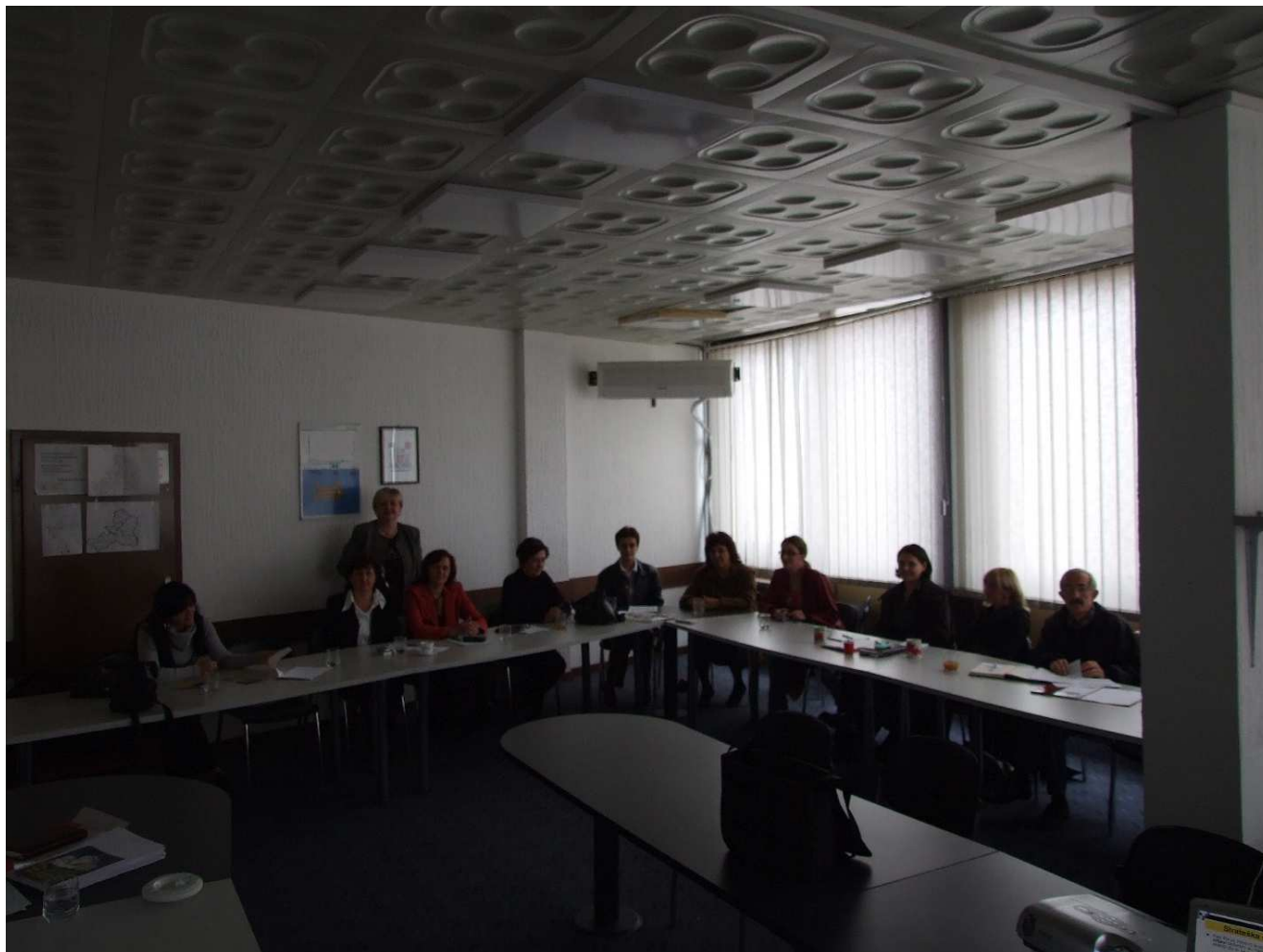
Одбор за социјалну политику Топола

Општински одбор за социјалну политику је основано као саветодавно тело председника општине Тополе, а основни задаци Одбора су: израда Стратешког плана општине, да анализира потребе најугроженијих група грађана, указује на постојеће ресурсе за подмирење потреба најугрожених група грађана, ради нацрте плана за побољшање решавања задовољавања потреба најугроженијих група грађана, ради пројекте и акционе програме из ове области за решавање конкретних питања или група питања и друго.